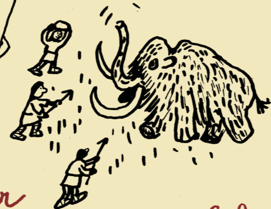
Karel Jaromír Erben