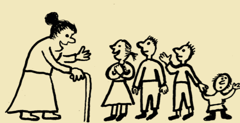
Clive Staples Lewis