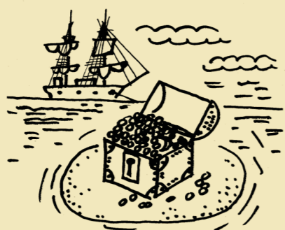
V. Victor Hugo