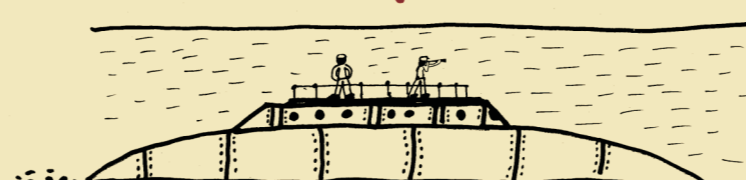
Arthur Conan Doyle