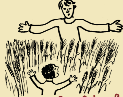
Jonathan Swift kolektiv anonymních starověkých autorů