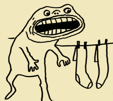
Antoine de Saint Exupéry